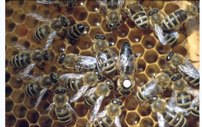
Königin mit Hofstaat