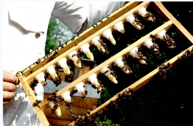
Viele verdeckelte Weiselzellen